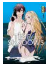
Time shadows Yasuki TANAKA (Kana)