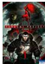
Tsumugi project IPPATU (Ki-oon)