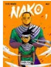
Nako Tiers Monde et Max (Michel Lafon)