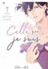
Celle que je suis Bingo MORIHASHI (Akata)