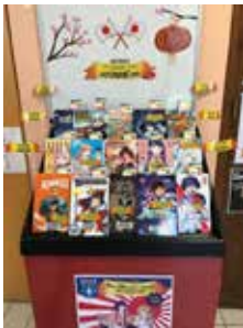
Bibliothèque municipale - Charny

Les établissements intéressés par le prix SaYONNE'ara (bibliothèques, CDI de collèges et lycées) s'inscrivent auprès de leur référent secteur. Ils ne sont pas tenus d'acheter toutes les catégories mais doivent en posséder au moins une. Les lecteurs ont l'obligation de s'inscrire dans les structures participantes. Ils lisent l'ensemble des mangas de la ou les catégorie(s) choisie(s) afin de voter pour leur manga préféré avant la date butoir.