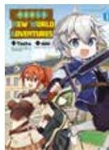
Noble New World Adventures YASHU (Komikku)