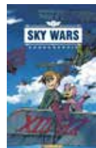
Sky Wars Dongshik AHN (Casterman)