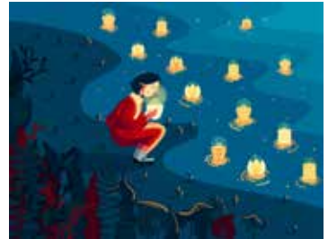
Le O-bon et le Bon-odori

Le O-bon est un festival célébrant le retour des âmes des ancêtres, qui a lieu chaque année du 13 au 15 août. Les japonais retournent dans leur ville d'origine pour honorer les tombes de leurs ancêtres.