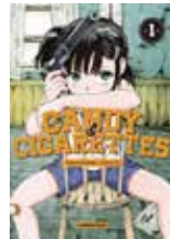
Candy & Cigarettes Tomonori INOUE (Casterman)