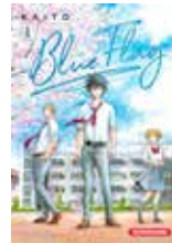
Blue flag KAITO (Kurokawa)