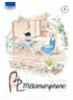
BL Métamorphose Kaori TSURUTANI (Ki-oon)