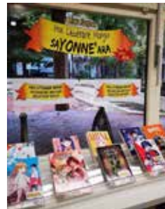
Bibliothèque Jacques-La- Carrière – Auxerre

Tout au long de l'année plusieurs actions sont réalisées dans le cadre du prix littéraire manga SaYONNE'ara :