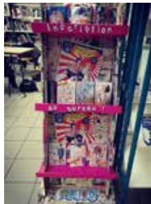
Lycée Louis-Davier - Joigny