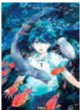
Deep sea aquarium MagMell Kiyomi SUGISHITA (Vega)