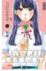
Jardin secret AMMITSU (Kana)