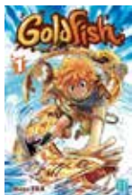
Goldfish Nana YAA (Nobi nobi!)