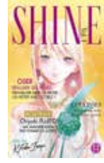
Shine Kotoba INOYA (Nobi nobi !)