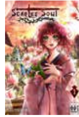
Scarlet Soul Kira YUKISHIRO (H2T)